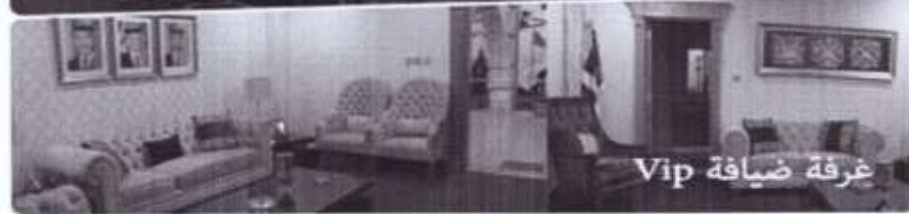
غرفة ضيافة Vip