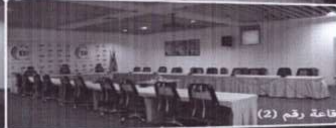
قاعة رقم (2)