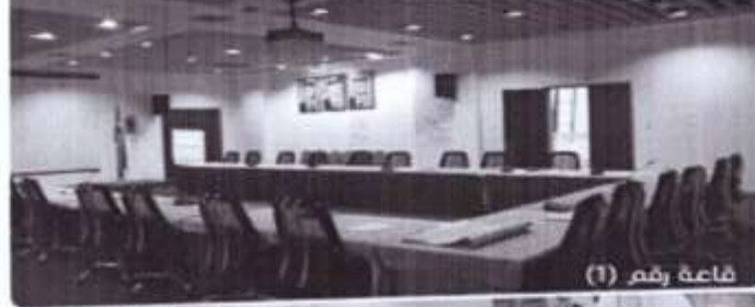
قاعة رقم (1)