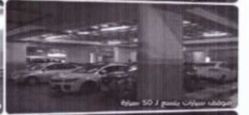
موقف سيارات يتسع لـ 50 سيارة