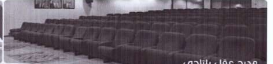
مدرج عقل بلتاجي